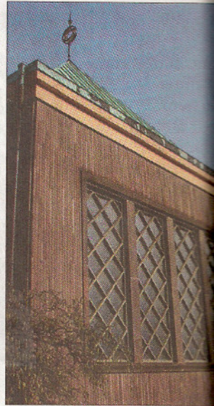
Im Synagogensaal (l.) versammelt sich die Gemeinde zum Gottesdienst. Die 1958 errichtete Synagoge entstand nach Plänen des Architekten Karl Gerle.

oder vertrieben. Ursache waren Gräuelmärchen, sie hätten die Brunnen vergiftet und damit die Pest ins Land gebracht.